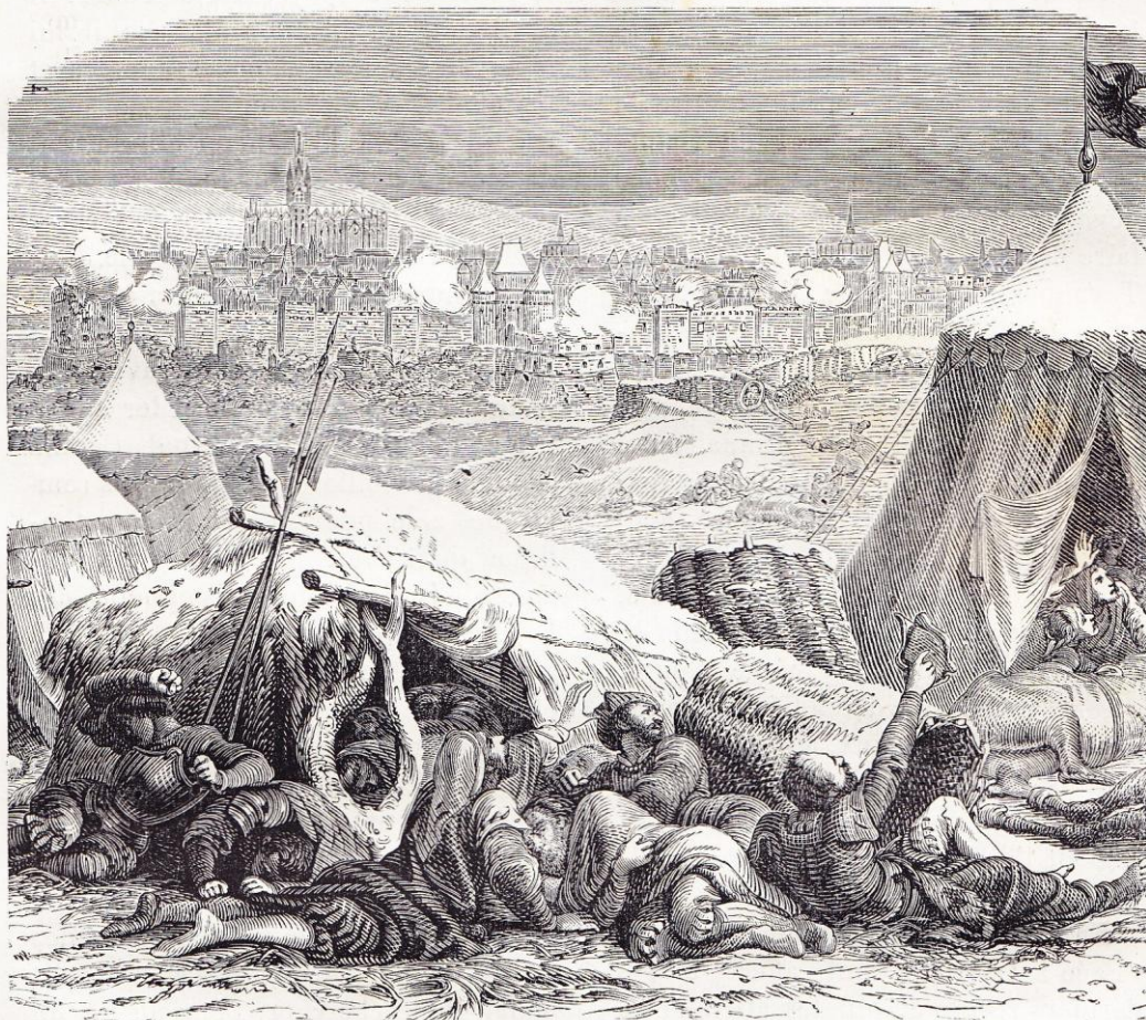
Le siège de Metz (1552).

Mais il n'osa pas commander l'assaut, car pour un mur qui s'écroulait deux autres se construisaient derrière, sans compter les barricades et les fossés ni les mines qui détruisaient tous les travaux des assiégeants. Au mois de novembre, l'armée allemande avait perdu